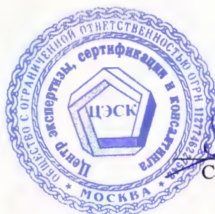
Скоблик А.А. Эксперт